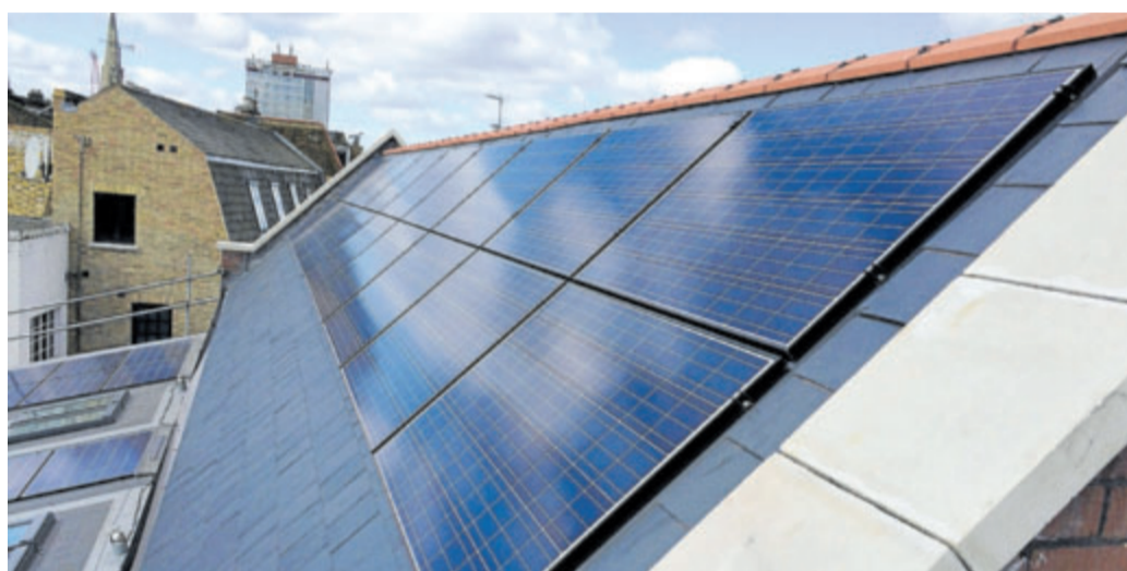
KDE ŽE LOŇSKÉ SNĚHY JSOU. Fotovoltaika dnes přežije už i bez dotací.

Expert na energetiku Jiří Gavor z konzultační společnosti ENA k tomu dodává: „Obliba fotovoltaiky u nás přichází s jistým zpožděním oproti jiným zemím. Největším tahounem oboru je