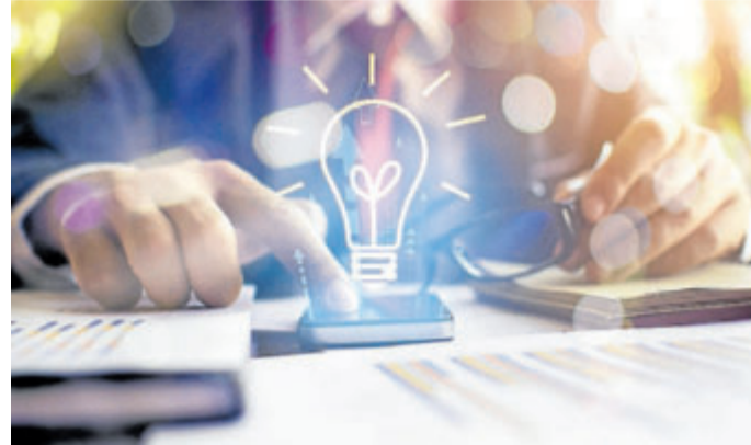
ŽÁROVKA V HLAVNÍ ROLI. Bohužel, v rukou nečestných agentů se změnila ve zbraň.

Vysoké zákonné ochrany se spotřebitel těší například při odstoupení od smlouvy, pokud k podpisu došlo s využitím donucovacích prostředků, nátlaku a klamání ze strany obchodních zástupců. Na základě § 11a energetického zákona mohou občané již druhým rokem vypovědět takovou smlouvu do patnáctého dne po zahájení dodávky plynu nebo elektřiny, aniž by mohli být postiženi pokutou či sankcí.